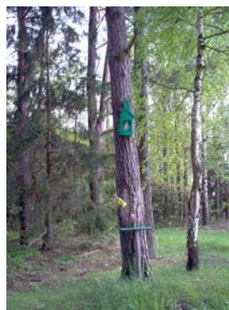
Drewniana kapliczka

34,3 km Wjeżdżamy do Lebedzina. Skrzyżowanie dróg w lewo do wsi Komaszówka, w prawo kolonie Lebedzin my jedziemy przed siebie.