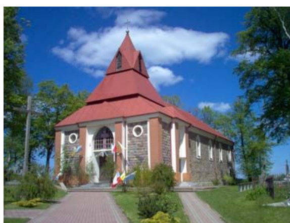
Kościół św. Rocha w Krasnymborze z XIX wieku

JAMINY - siedziba parafii z wybudowanym, drewnianym, zabytkowym kościołem z początku XIX wieku.