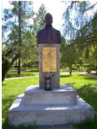
Popiersie K. Brzostowskiego