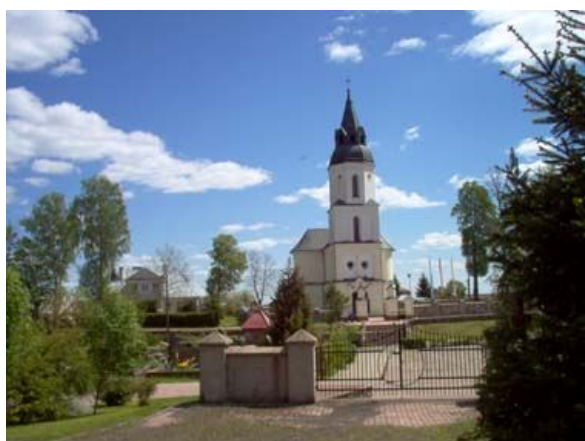
Kościół w Krasnymborze. Przełom XVI i XVII wieku

KRASNYBÓR - znajdują się tu dwa zabytkowe kościoły, jeden p.w. Św. Rocha z XIX wieku, a drugi z przełomu XVI wieku, który uznany został za zabytek klasy zerowej.