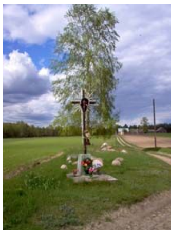
Przydrożny żelazny krzyż