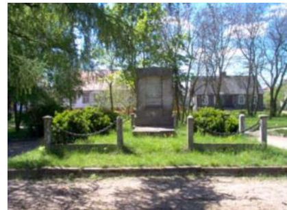
Pomnik w parku

1,3 km Szlak nasz z krajowej 19 skręca w lewo na drogę do Lipska. Tuż po wjechaniu na tę drogę po prawej stronie znajduje się pomnik upamiętniający odbicie Sztabina z rąk niemieckich przez VIII Uderzeniowy Batalion Kadrowy UBK Armii Krajowej.