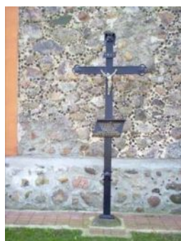
Grób ks. J. Zaleskiego