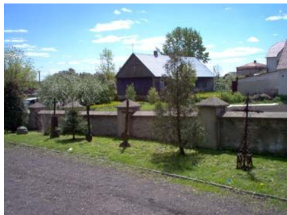
Krzyże wykonane w Hucie Sztabińskiej