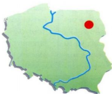
Rys.1 Lokalizacja gminy Sztabin