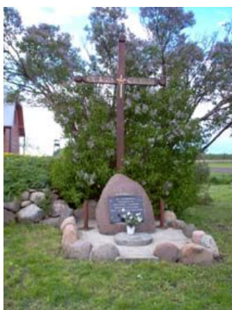
Pomnik upamiętniający pacyfikację wsi Kopytkowo i Jasionowo

Wracamy do skrzyżowania, które mijaliśmy na 67,4 km odcinku szlaku.