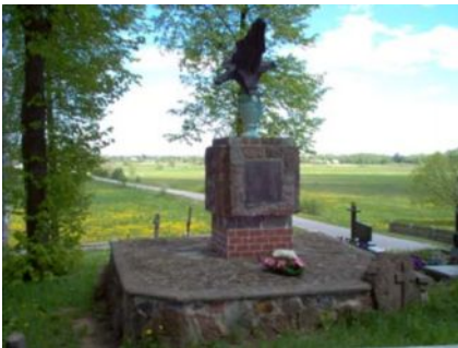
Pomnik kryjący groby żołnierzy Powstania Styczniowego 1863r.