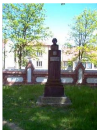
Popiersie J.L. Chreptowicza