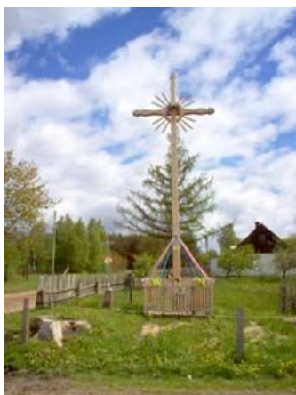
Drewniany krzyż przed wjazdem do miejscowości Lebiedzin

12,2 km Po prawej duży ładny drewniany krzyż i tuż za krzyżem droga żwirowa do miejscowości Lebiedzin.