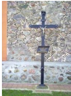
Grób ks. J. Zaleskiego