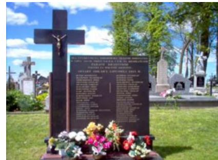
Pomnik ofiar zbrodni NKWD i UB z obławy lipcowej 1945r.

9,8 km W lewo odchodzi droga do Krylatki, którą my podążamy. Zaraz po lewej stronie znajduje się sklep spożywczy.