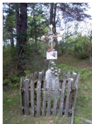
Żelazny krzyż ogrodzony drewnianym płotkiem

14,0 km Kończy się droga asfaltowa, a zaczyna żwirowa, jedziemy lasem.