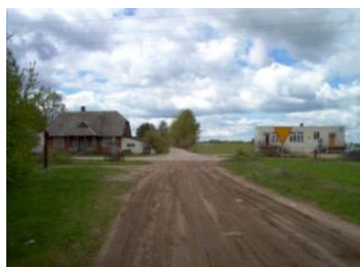
Skrzyżowanie z krajową 19

Równoległe do niej przebiegał od 1851 roku pierwszy w Europie kontynentalnej telegraf, łączący biuro fabryczne w domu hrabiego z jego zakładami w Hucie. (Zjeżdżając ze szlaku w prawo w kierunku Augustowa po około 0,3 km po lewej stronie na wzniesieniu znajduje się dworek cisowski hrabiego Karola Brzostowskiego z ok. 1835r., a po prawej żwirownia).