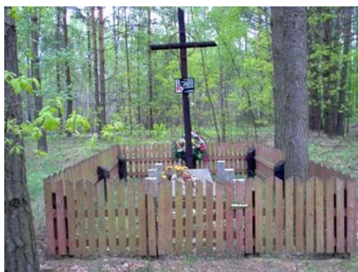
Miejsce egzekucji 24 mieszkańców pobliskich wsi.

95,2 km Po prawej lasek w którym rozstrzelano mieszkańców pobliskich miejscowości podczas wojny upamiętnione grobem. Miejsce tej egzekucji znajduje się 0,1 km od drogi.