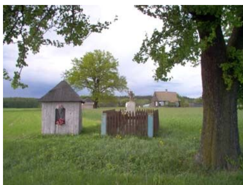
Kapliczka przydrożna z krzyżem

90,9 km Mijamy kapliczkę z krzyżem po lewej stronie.