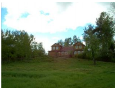
Stara szkoła w Hucie