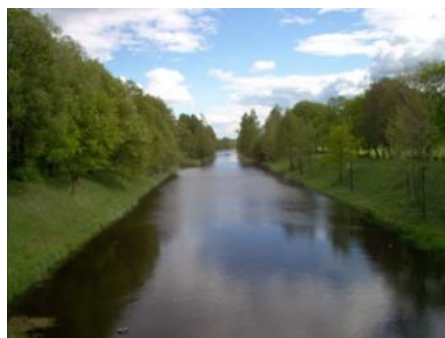
Śluz na kanale Augustowskim w Sosnowie

60,7 km W lewo droga prowadząca do leśniczówki.