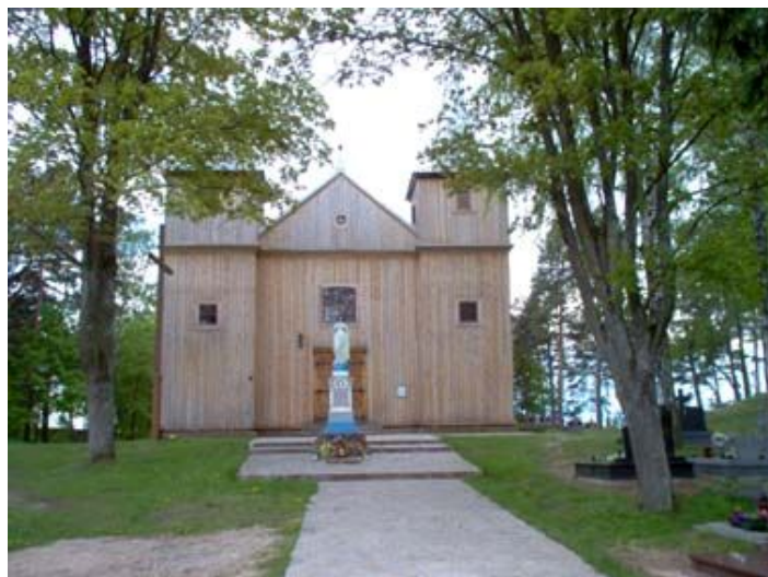
Kościół p.w. św. Mateusza w Jaminach