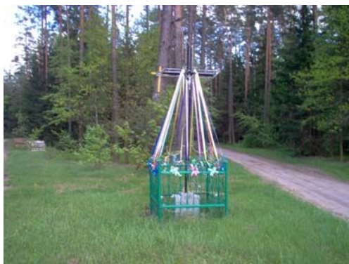
Przydrożny żelazny krzyż

34,0 km Rozjazd dróg, my jedziemy prosto mijając po lewej żelazny przydrożny krzyż, a kilka metrów dalej drewnianą kapliczkę wiszącą na drzewie. Przed nami wieś Lebedzin.