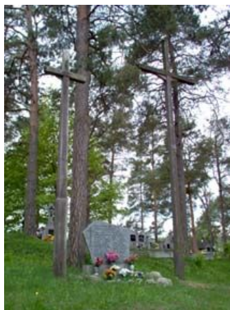
Tablica ku pamięci ofiar NKWD i UB na cmentarzu w Jaminach

Obok kościoła stoi krzyż upamiętniający miejsce stracenia 24 mieszkańców wsi, rozstrzelanych przez Niemców 20 czerwca 1944 roku za zabicie hitlerowskiego żandarma.