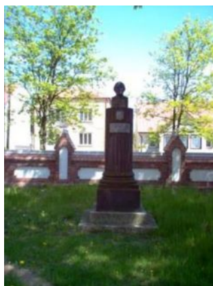
Popiersie J.L. Chreptowicza