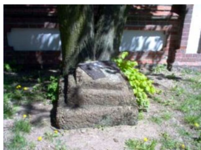
Zegar słoneczny