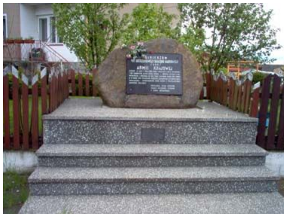
Pomnik upamiętniający zdobycie posterunku żandarmerii przez partyzantów VIII UBK AK

1,3 km Szlak nasz z krajowej 19 skręca w lewo na drogę do Lipska. Tuż po wjechaniu na tę drogę po prawej stronie znajduje się pomnik upamiętniający odbicie Sztabina z rąk niemieckich przez VIII Uderzeniowy Batalion Kadrowy UBK Armii Krajowej.