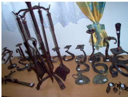
Wyroby kowalskie

20,1 km Skrzyżowanie dróg, jedziemy w lewo drogą pożarową nr 7.