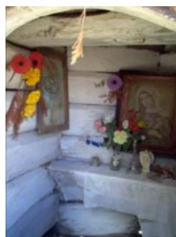
Wnętrze kapliczki