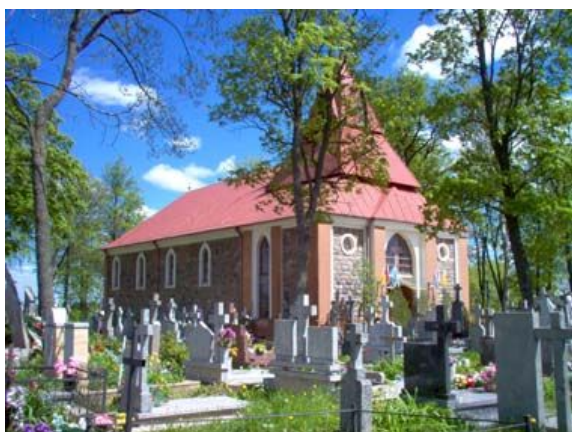
Kościół św. Rocha w Krasnymborze

W 1870 roku parafianie wystawili na cmentarzu grzebalną kaplicę, która przed kilkoma laty została rozbudowana i pełni funkcję kościoła parafialnego pod wezwaniem św. Rocha. Wcześniejszy, drewniany kościół parafialny istniał (oprócz zakonnego) w Krasnymborze do 1830 roku. 25