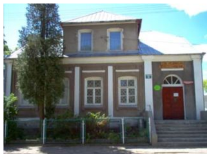
Izba Regionalna w Sztabinie