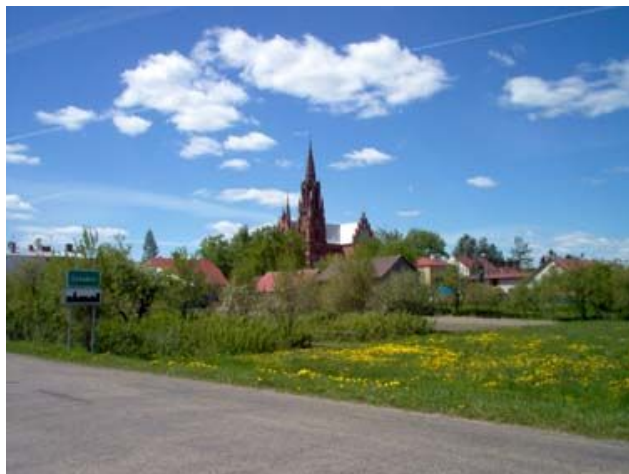
Panorama Sztabina

SZTABIN - duża wieś gminna nad rzeką Biebrzą, na trasie Augustów - Białystok. Obecnie Sztabin liczy około tysiąca mieszkańców. Znajduje się tu: szkoła podstawowa, ośrodek zdrowia, apteka, poczta, masarnia, zabytkowy kościół, cmentarz, a także dwa tartaki, piekarnia, ciastkarnia oraz sieć sklepów i zakładów usługowych.