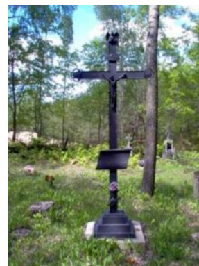
Cmentarne krzyże wytapiane w hucie żelaza Karola Brzostowskiego