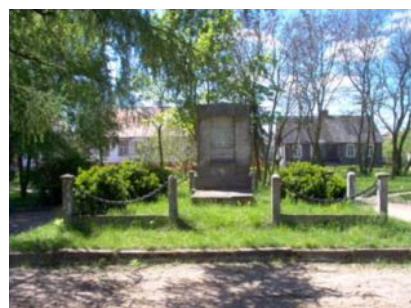
Pomnik w parku