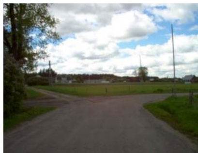
Pole na którym stała huta żelaza i szkła

Natomiast przed nami ukazuje się plac sprawiający wrażenie rynku. Wyznaczają go drogi z Motułki (dawniej Augustowa), Cisowa (Krasnegoboru), Fiedorowizny i Kopca.