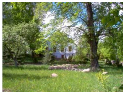
Dworek K. Brzostowskiego

18,1 km W prawo droga dojazdowa do leśniczówki.