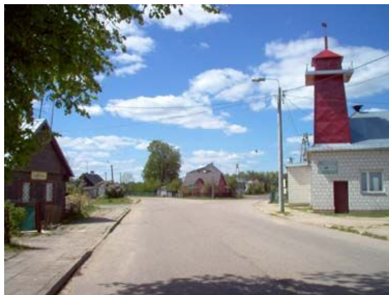
Z prawej strony fragment budynku Ochotniczej Straży Pożarnej w Sztabinie

28,9 km Po lewej Ochotnicza Straż Pożarna (OSP) w Sztabinie.