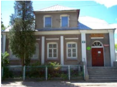
Izba Regionalna w Sztabinie