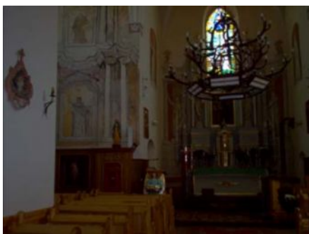
Wnętrze kościoła w Krasnymborze.

podkomorzy nowogrodzki, ufundował pobudowany w latach 1584 – 1589 unikatowy na tych terenach – na rzucie krzyża greckiego – mutowany kościół, którego architektura łączy formy renesansowo – późnogotyckie z tradycjami średniowiecznego budownictwa sakralnego ziem ruskich. Świątynia (pod wezwaniem Zwiastowania Najświętszej Maryi Panny) ma długość 21 m, szerokość 15 m i wieżę 30 m. Wieża nakryta miedzianym hełmem, nadbudowana w 1913 roku, widoczna jest z odległych okolic. W ołtarzu głównym znajduje się czczony przez wiernych obraz olejny na płótnie z około połowy XVII wieku, z wizerunkiem Matki Boskiej z Dzieciątkiem; w ołtarzu bocznym – rzeźba Jezusa Ukrzyżowanego z przełomu XVII i XVIII wieku.