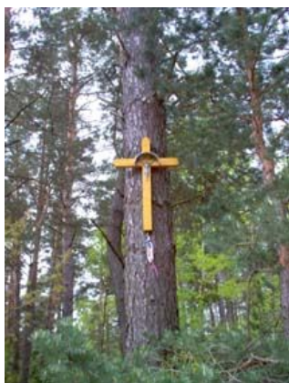
Drewniany krzyż na drzewie

13,0 km Po lewej drewniany wiszący krzyż na drzewie i stojący nieopodal żelazny krzyż ogrodzony płotkiem. Po prawej natomiast piaszczysta droga dojazdowa do miejscowości Lebiedzin i Długie.