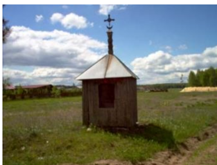
Przydrożna kapliczka

25,9 km Jadąc dalej mijamy drewnianą kapliczkę (po prawej).