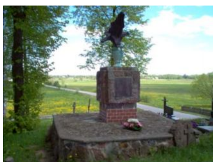
Pomnik kryjący groby żołnierzy Powstania Styczniowego 1863r.