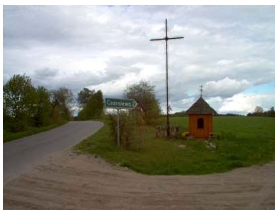
Przydrożna kapliczka z krzyżem

94,4 km Rozwidlenie dróg my jedziemy asfaltem (w lewo), natomiast w prawo droga dojazdowa do wsi Czarniewo. Na rozdrożu tych dróg kapliczka z krzyżem.