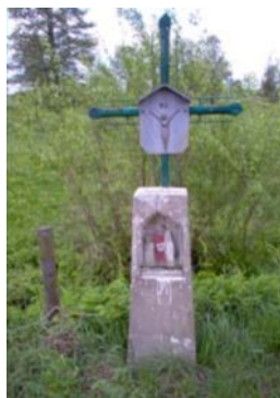
Przydrożna kapliczka we wsi Ściokła

11,4 km Po lewej niewielka przydrożna kapliczka we wsi Ściokła