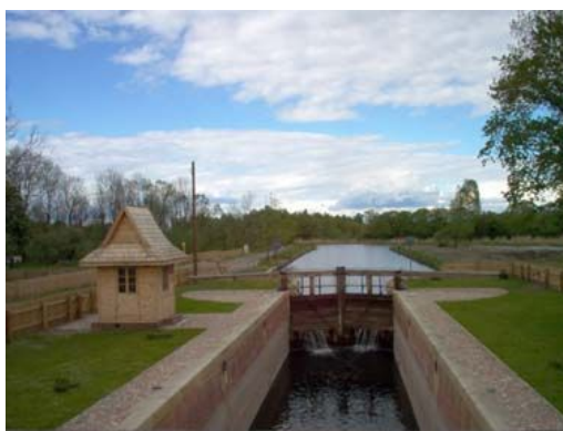
Śluza w Dębowie

75,3 km Miejscowość Dębowo po lewej stronie rzeka Biebrza i w dole prywatne pole namiotowe, natomiast po prawej kolejna śluza na kanale Augustowskim i druga w gminie Sztabin (ostatnia budowla tego typu na kanale przed połączeniem z rzeką Biebrzą, niedawno odrestaurowana).