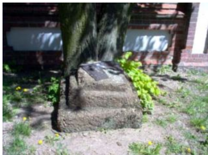
Zegar słoneczny