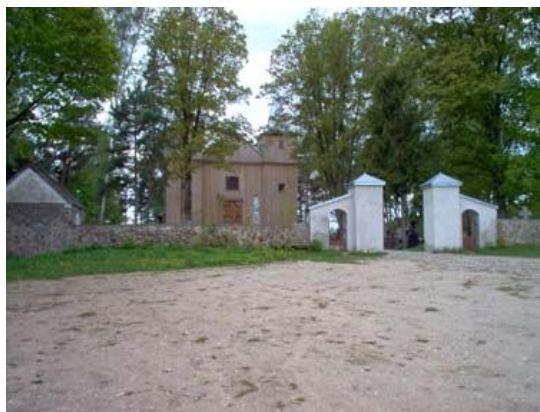
Kościół i cmentarz w Jaminach

Do parafii Jamin należy 12 okolicznych wiosek i około 1800 wiernych.