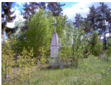
Przydrożny krzyż

25,9 km Jadąc dalej mijamy drewnianą kapliczkę (po prawej).