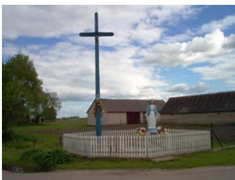
Przydrożna kapliczka we wsi Jaziewo