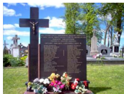
Pomnik ofiar zbrodni NKWD i UB z obławy lipcowej 1945r.

9,8 km W lewo odchodzi droga do Kryłatki. Nasz szlak natomiast prowadzi prosto drogą z pierwszeństwem.